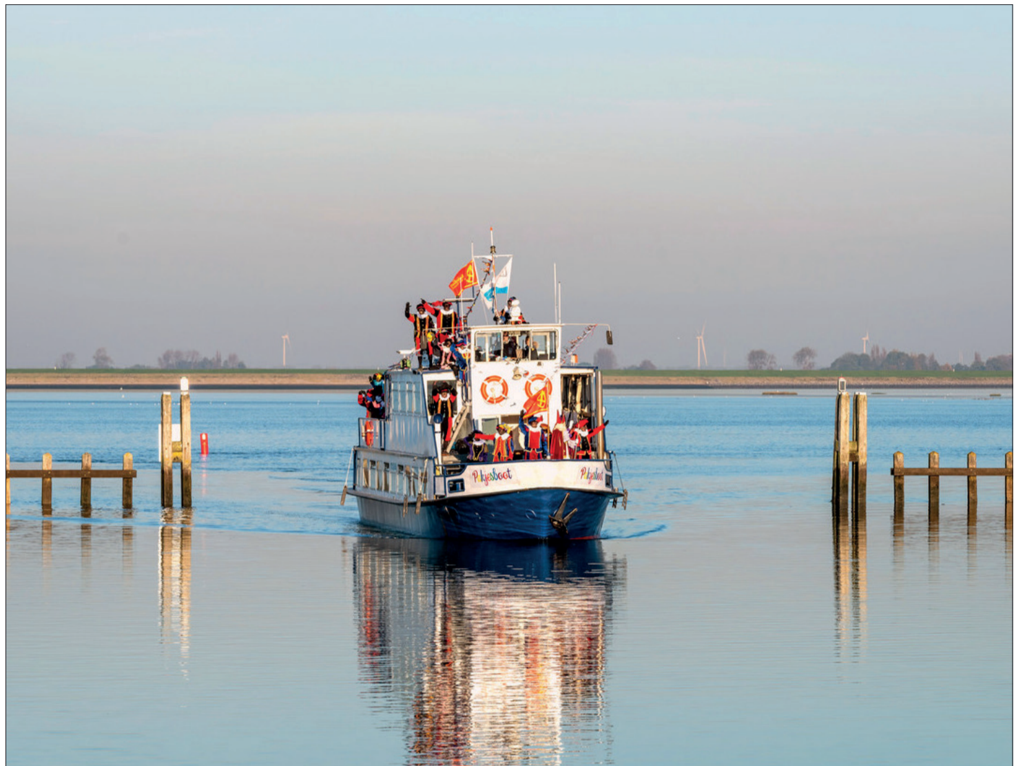
Archieffoto van een van de eerdere intochten. Normaal gesproken komt ieder jaar de Pakjesboot binnenvaren met heel veel Pieten aan boord.